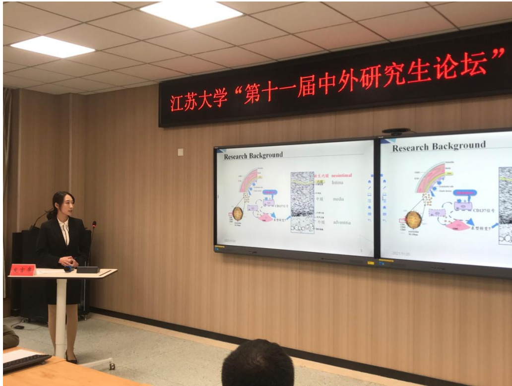
图为参会者汇报学术研究成果

本次论坛为生物医药相关学科中外研究生提供了学术交流平台，帮助研究生拓宽了研究视野，促进了中外研究生间的交流学习。