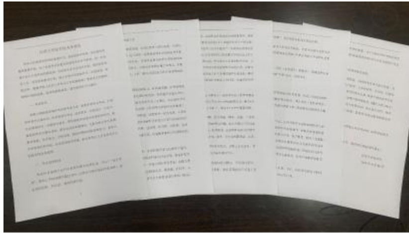
修改制定《江苏大学医学院考务规定》

绝泄题漏题，加强考试命题、监考和阅卷等考试过程的规范管理，体现考试的公平、公正原则。