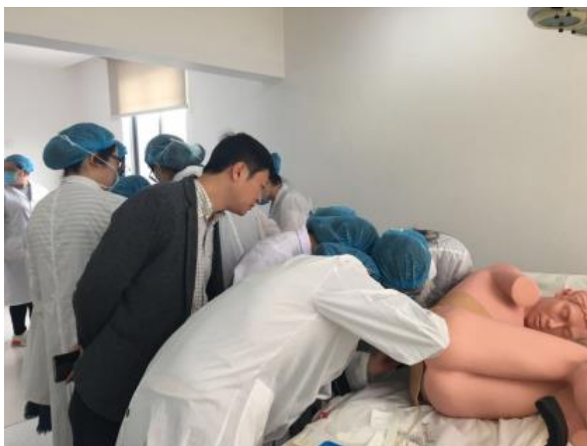
14、15级开展为期两个月的临床技能训练

医学院组织临床医学专业四年级的学生进行临床技能训练，训练历时两个月，并开放临床技能中心实验室供学生练习，做到教师辅导与学生自我训练相结合，教学相长，逐步提升临床医学生的临床技能水平。训练结束后组织考官对学生进行临床技能的理论、操作综合考核，检验学生掌握程度。在此基础上，每年年底举办临床技能大赛。