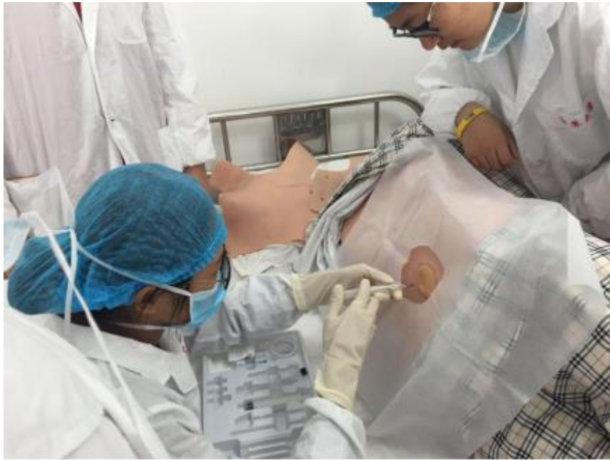
14、15级开展为期两个月的临床技能训练