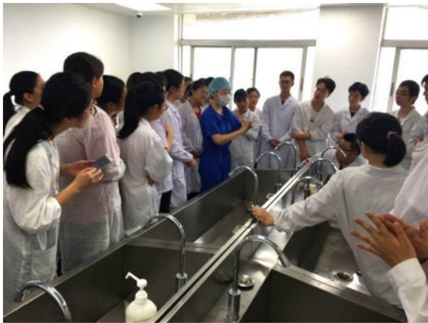
14、15级开展为期两个月的临床技能训练