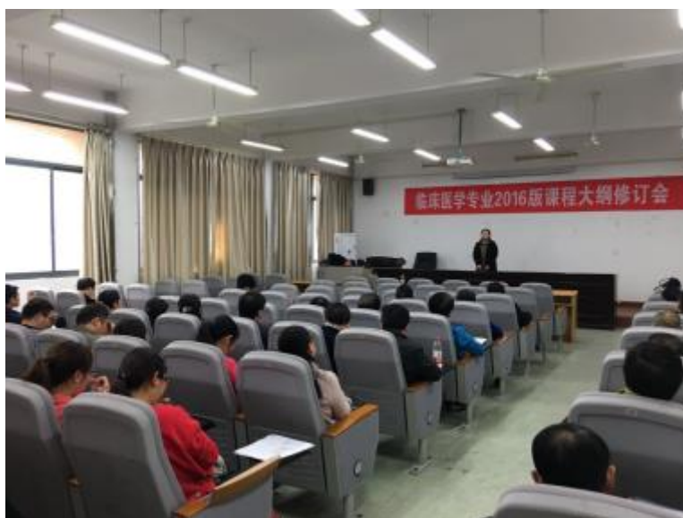
临床医学专业 2016 版课程大纲修订会

针对临床医学专业认证专家组的意见，在比较国内同类医学院校临床见习课与理论课课时比列设置的基础上，并广泛征求了多方意见，提出了调整方案，并作为 2018 年 7 月 28 日临床集体备课重要议题进行了讨论，最后通过调整方案。修订了临床医学 2018 版培养计划。